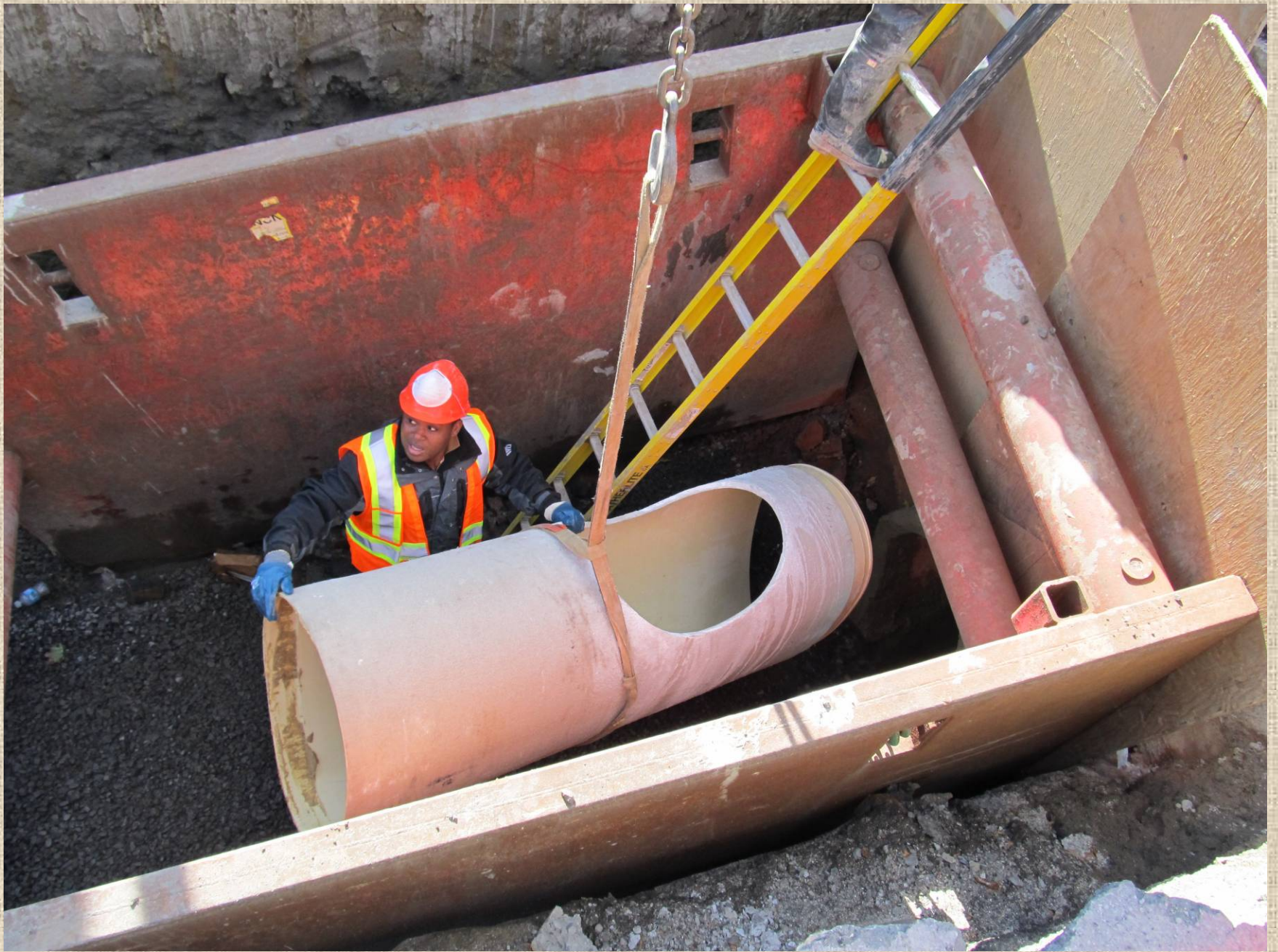
Deuxième essaie: Descente de chacun des segments