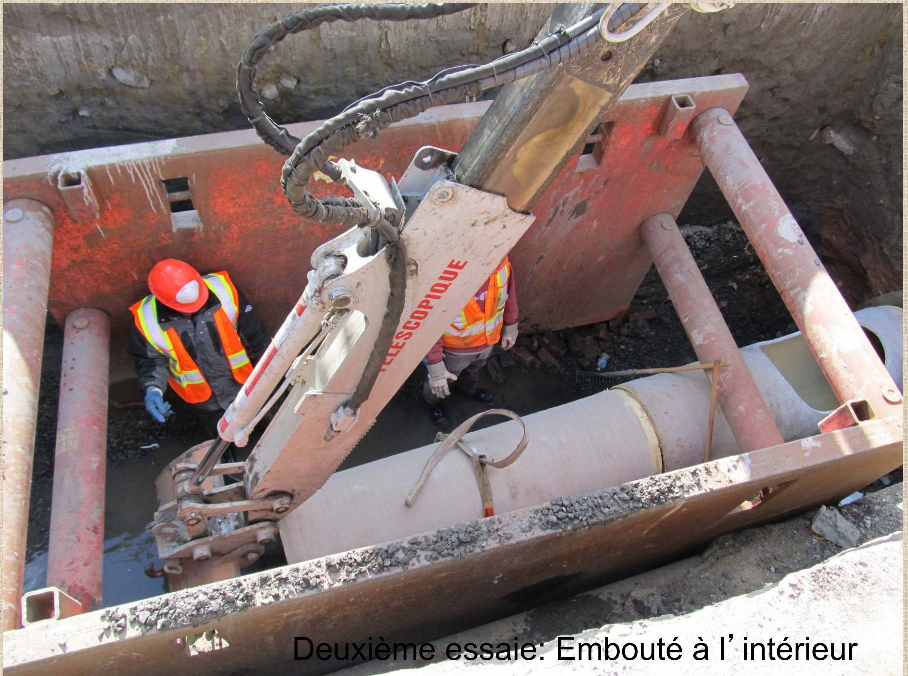
Deuxième essaie: Embouté à l'intérieur