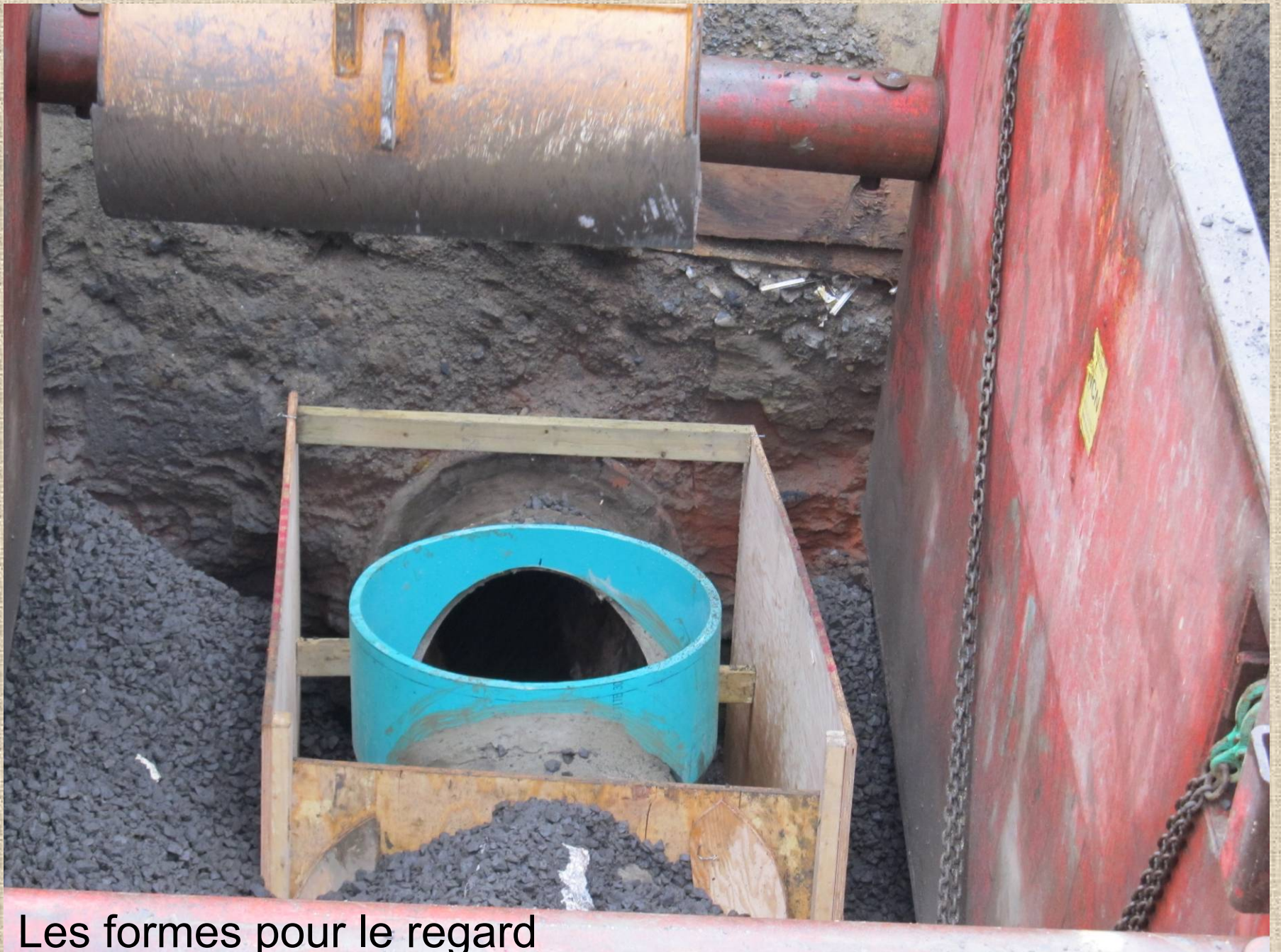
Les formes pour le regard